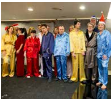
Senzibilizacija učenika u školama