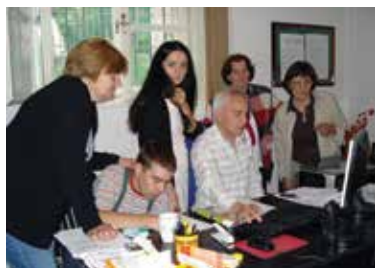
Sastanak u kafiću